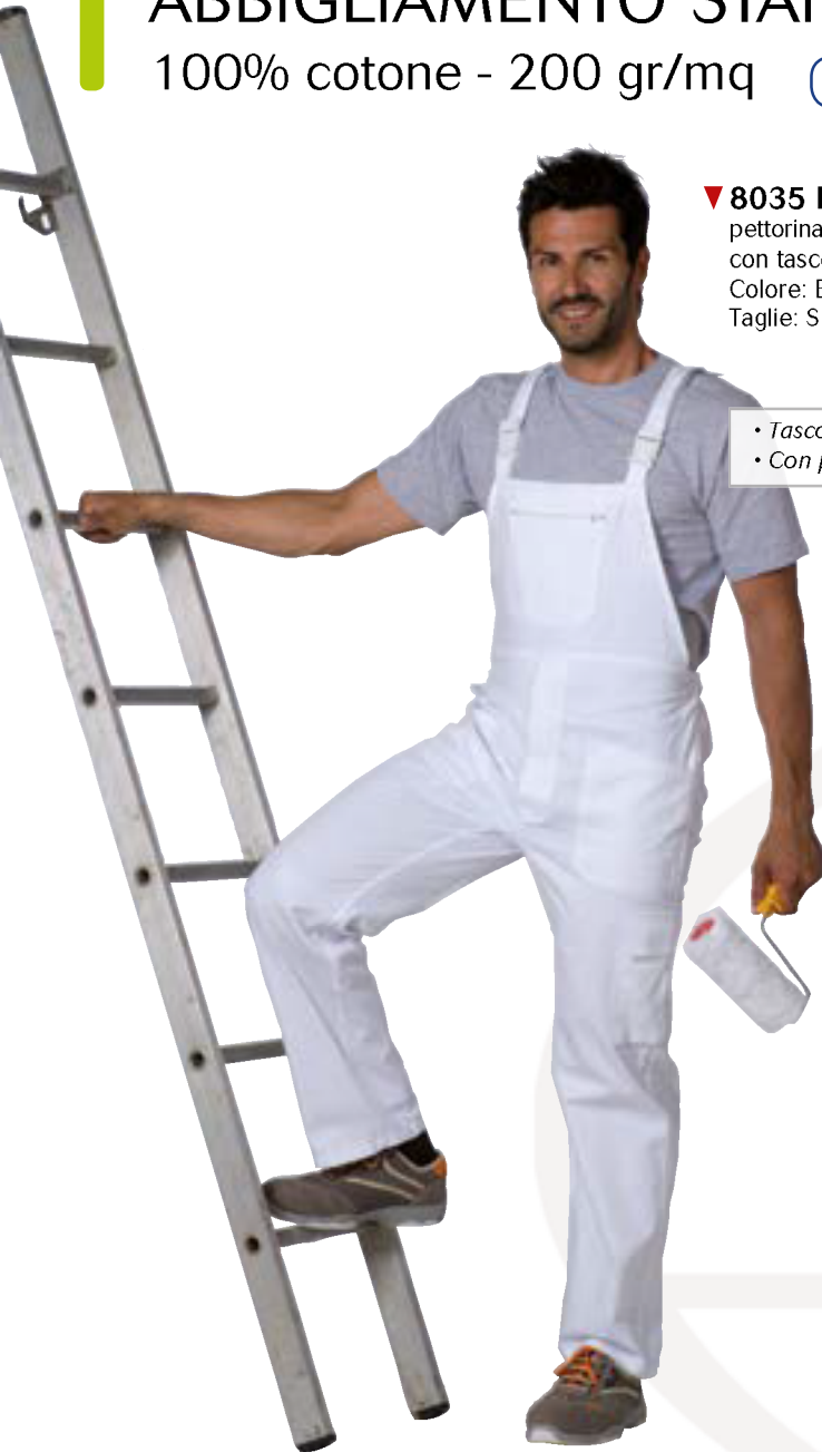
▼ 8035 BIANCO pettorina 200 gr. con tascone Colore: Bianco Taglie: S / XXL

100% cotone - 200 gr/mq ideale per tutte le stagioni