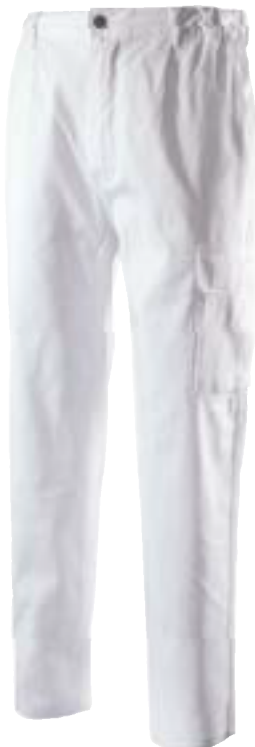
◀ 8030 BIANCO pantalone 200 gr con tascone Colore: Bianco Taglie: XS / XXXL