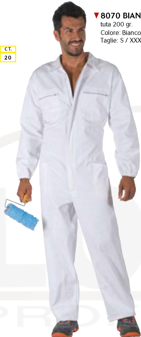
▼ 8070 BIANCO tuta 200 gr. Colore: Bianco Taglie: S / XXXL