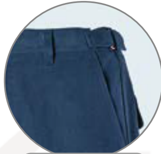
REGOLATORE TAGLIA IN VITA