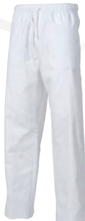
◀ 8030 ZGS pantalone con coulisse in vita Colore: Bianco Taglie: XS / XXL