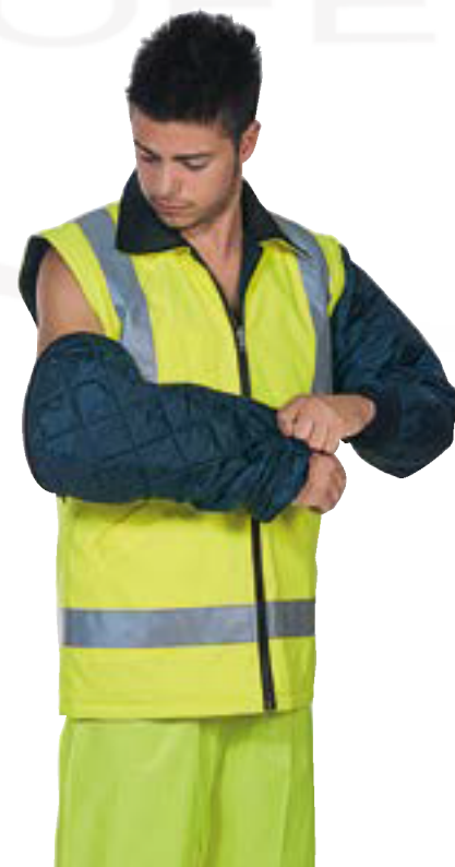
Tre in uno TRIPLO USO