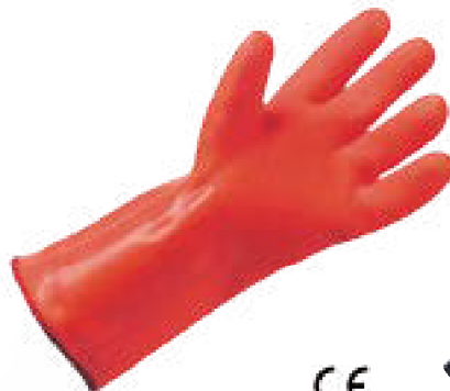
▲ 3352 PVC fodera termica colore: arancio taglia: unica