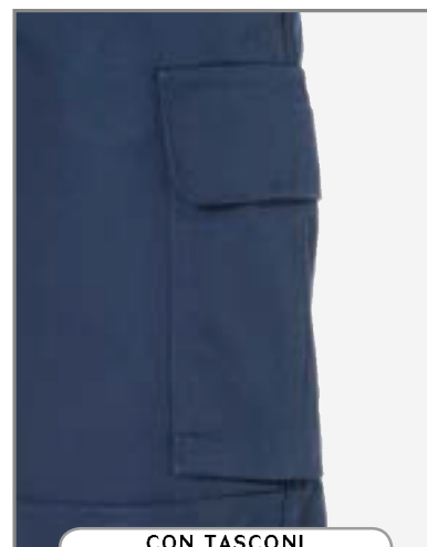
CON TASCANI LATERALI