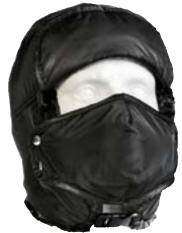
▲ HA13 berretto termico Colore: Nero Taglia: Unica