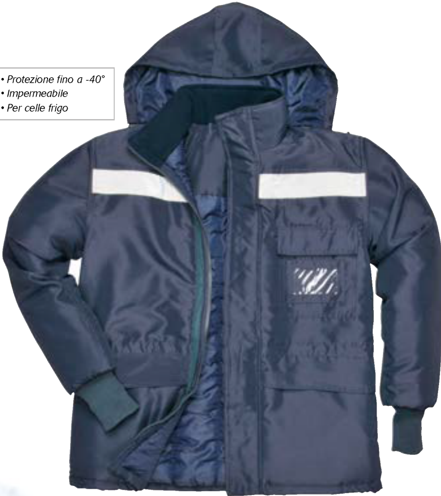
▲ CS10 giacca 100% oxford con imbottitura termica Colore: Blu Taglie: M / XXL