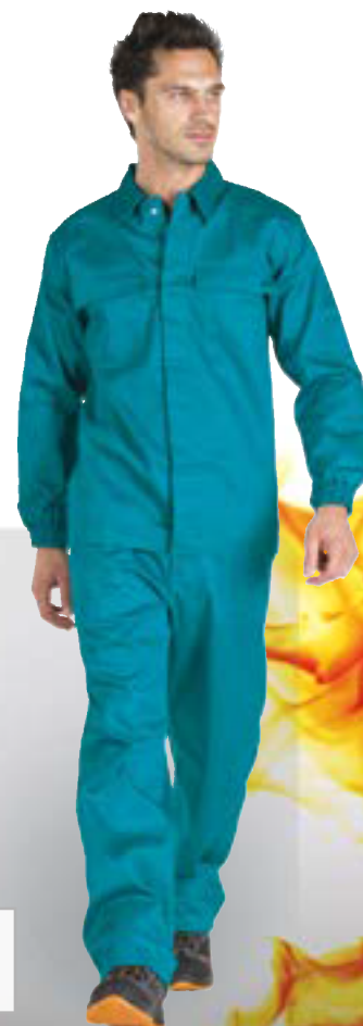
▲ IGN05128 giubbotto ignifugo e resistente all'arco elettrico